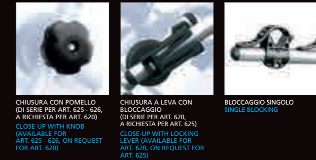
CHIUSURA CON POMELLO (DI SERIE PER ART. 625 - 626, A RICHIESTA PER ART. 620) CLOSE-UP WITH KNOB (AVAILABLE FOR ART. 625 - 626, ON REQUEST FOR ART. 620) CHIUSURA A LEVA CON BLOCCAGGIO (DI SERIE PER ART. 620, A RICHIESTA PER ART. 625) CLOSE-UP WITH LOCKING LEVER (AVAILABLE FOR ART. 620, ON REQUEST FOR ART. 625) BLOCCAGGIO SINGOLO SINGLE BLOCKING