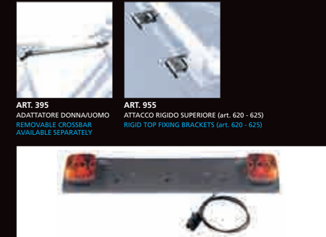
ART. 395 ADATTATORE DONNA/UOMO REMOVABLE CROSSBAR AVAILABLE SEPARATELY ART. 955 ATTACCO RIGIDO SUPERIORE (art. 620 - 625) RIGID TOP FIXING BRACKETS (art. 620 - 625)